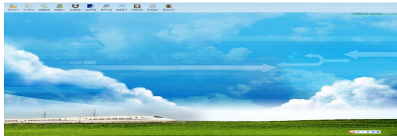
图 1 学生购票优惠卡防伪系统软件

搜索 www.stcard.cn ，点击“资料下载”，下载“学生购票优惠卡防伪系统（全新安装使用）”，本软件为免安装软件，直接运行 KhTagTrain.exe，打开软件，如图 1 主窗口。